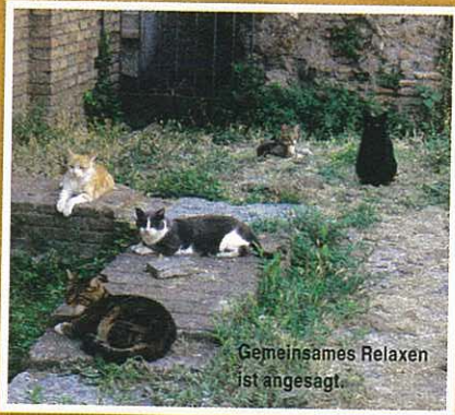
Gemeinsames Relaxen ist angesagt.

stätte handle es sich um ein bedeutendes Kulturerbe, was einen Anschluss an die Kanalisation nicht zulasse. Diese Antwort ist umso unverständlicher, als dass der Plan keine historisch relevanten Bauten tangiert und eine Entsorgung des Abwassers vielmehr zur Schonung der Ruinen beigetragen hätte. Aber wer weiss, vielleicht sehen das auch irgendwann die Behörden ein – das ungebrochene Engagement der Katzenschützer lässt auf jeden Fall eine Resignation nicht zu.