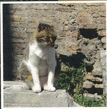
Neuankömmling mit Herpes-Virus.

Manche Menschen wollen eine Katze auswählen, wie wenn sie ein Paar Schuhe kaufen. Grösse, Farbe, Geschlecht und Exterieur, alles muss stimmen. Und manch einer geht ohne Katze nach Hause, denn ganz so einfach geben die Tierschützer die Tiere nicht her. Die Tierliebe muss spürbar sein, denn ein Leben im Tierasyl von Torre Argentina ist nicht ganz so übel, wie man vielleicht denkt. Natürlich fehlt es an allen Ecken und Enden. Und natürlich sind Streicheleinheiten bei so vielen Tieren oft Mangelware. Aber dennoch gibt es Katzen, die sich kein anderes Leben mehr denken können. Und es gibt Katzen, die auch unter solchen Bedingungen – sehr heisse Sommer, sehr kalte und feuchte Winter, keine fixen Bezugspersonen, keine dauerhafte