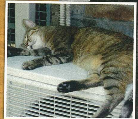
Hier wird kurzerhand die Klimaanlage zum Schlummerplatz umfunktioniert.