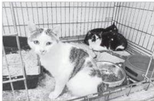
Algunos de los felinos que cuidan los voluntarios de la Protectora.

Con la colaboración de NetAP, la Protectora de Ciutadella y la Protectora de Maó pretenden evitar esta superpoblación y que los gatos mueran en la calle, atropellados, enfermos o por falta de alimento.