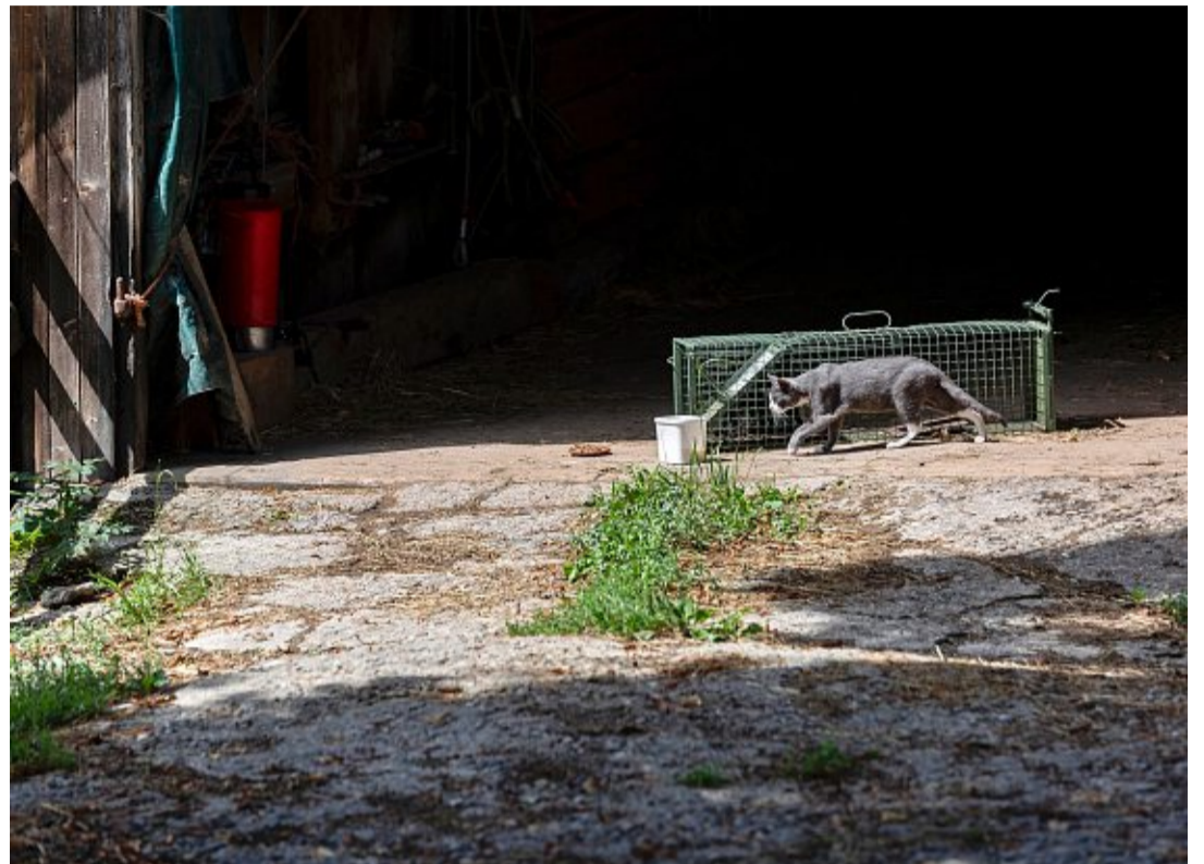
L'un des 52 chats de la ferme de l'Emmental rôde autour du piège. NICOLE PHILIPP

Selon la spécialiste, cela conduit à une situation incontrôlée dans laquelle «c'est finalement le bien-être des animaux qui en pâtit». Les chats deviennent sauvages, sont laissés à l'abandon, et reçoivent des soins médicaux insuffisants. Ils tuent d'autres animaux, notamment des oiseaux et des reptiles. Là encore, il n'existe que des estimations. Mais il de-