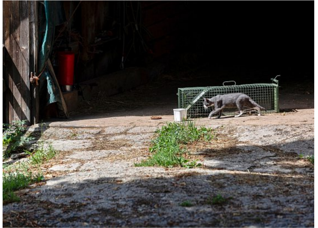
L'un des 52 chats de la ferme de l'Emmental rôde autour du piège. NICOLE PHILIPP

Selon la spécialiste, cela conduit à une situation incontrôlée dans laquelle «c'est finalement le bien-être des animaux qui en pâtit». Les chats deviennent sauvages, sont laissés à l'abandon, et reçoivent des soins médicaux insuffisants. Ils tuent d'autres animaux, notamment des oiseaux et des reptiles. Là encore, il n'existe que des estimations. Mais il de-